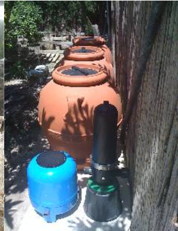
Decantador, Depósito regulador, Bombeo y Filtrado de anillas