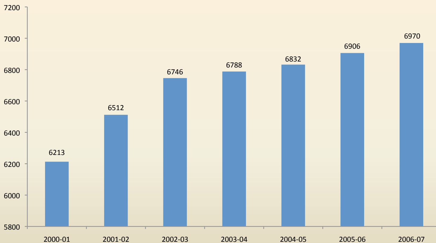
Evolución del número de escuelas primarias públicas